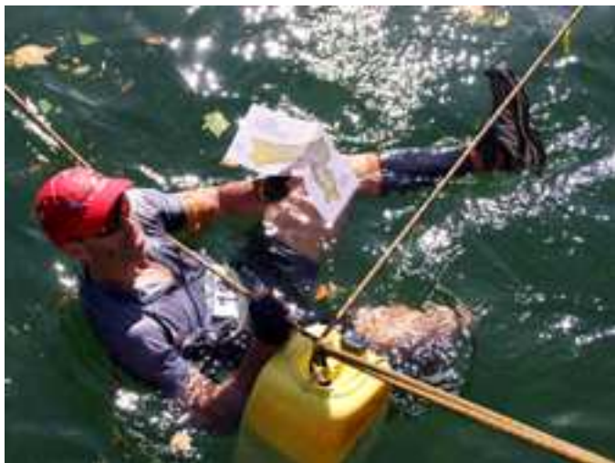
Démonstration de road-map waterproof dans le Gravezon.

Un petit bémol cependant, les compétitions : pour cette saison 2013-2014, nous constatons une baisse de participation.