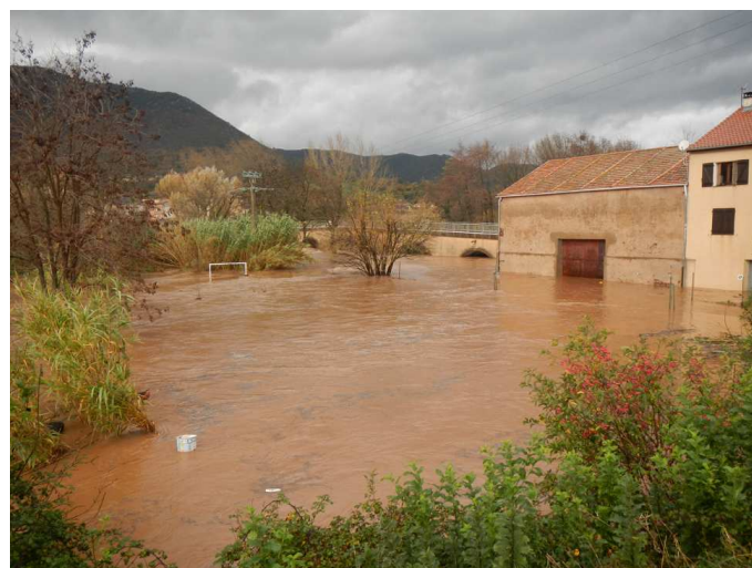
Le Pont d'Orb

Dès le samedi il aura fallu remettre en état l'école, la voirie pour les accès aux habitations notamment à Taillevent, et puis entreprendre des opérations de nettoyage dans tous les bâtiments et habitations touchés. L'eau potable a été affectée pendant plusieurs jours.