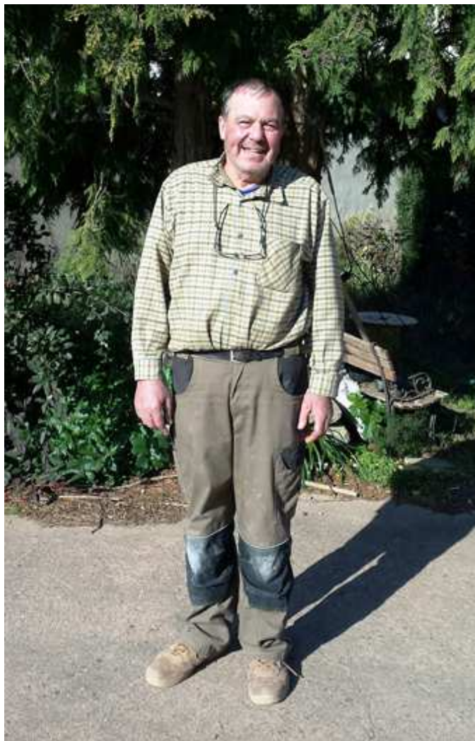
Electricien, artisan installé à Taillevent depuis près de quarante ans.

A la retraite, je souhaite m'occuper de l'association de chasse de Taillevent dont je suis président, la chasse et la pêche ayant toujours été mes passe-temps favoris.