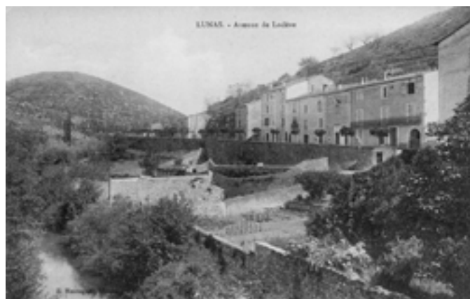
Le Vivier, photo de Ernest Boulouys, vers 1910. Entre 1875 et 1910, aucun changement notable n'a été effectué.

Fait étonnant, l'un des rapports apprend, qu'au cours de cette crue, le débit du Gravezon a été grandement amplifié par les eaux de la Tès qui, normalement, se jettent dans l'Orb à Ceilhes ! Au niveau des Cabrils un aménagement effectué « pour empêcher que les eaux de la rivière du Tès ne vinsent, par les tranchées du chemin de fer, faire irruption dans le vallon du Gravezon » cède : « le courant ayant enlevé la plus grande partie de la gleize, avait allégé le batardeau et les blocs qu'il traînait dans son courant ayant ébranlé les pilotis, le batardeau monta à la surface et partit d'une pièce, après avoir arraché ou cassé ses amarres... »