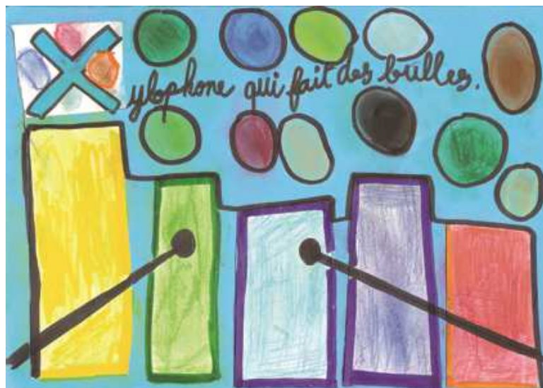
Amin - CE2