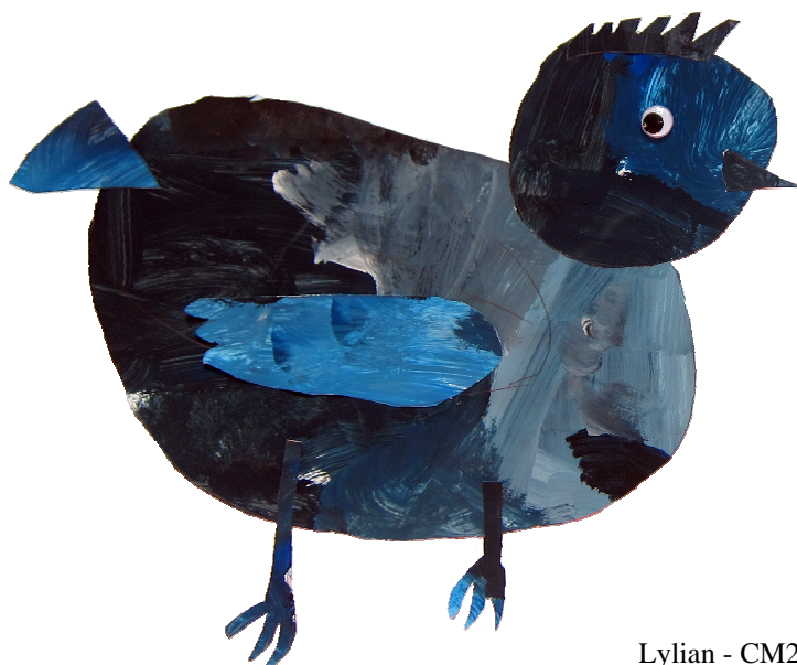
Lylian - CM2

Pour la prochaine période des vacances scolaires du 9 au 21 février 2015, les deux centres auront pour thème « La ferme en folie... » : découverte des animaux de la ferme, traite d'une chèvre, confection de beurre, de yaourt, visite d'une ferme... et des tas d'activités sur la nature.