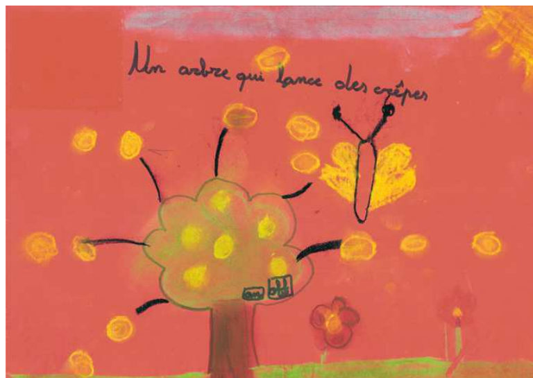
Eva - CE2