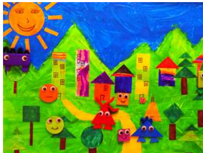
Création collective des élèves de maternelle