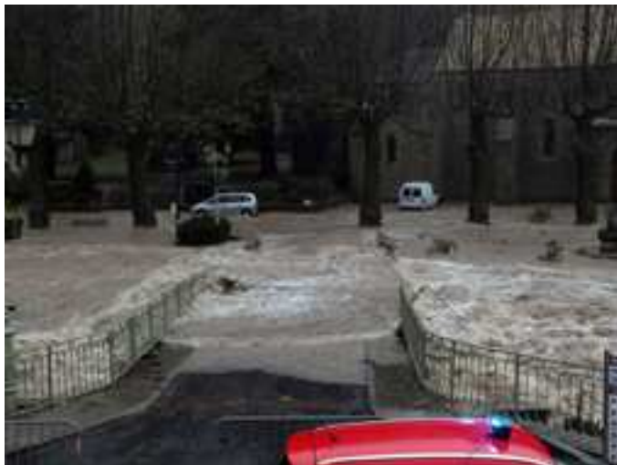
Le pont de l'Église

Le 28 novembre dernier la commune de Lunas a été frappée par des crues historiques dévastant de nombreuses habitations, équipements et propriétés. Beaucoup de Lunassiennes et de Lunassiens ont été affectés. En plus des dégâts il existe encore des traumatismes et des peurs lorsque la pluie survient. La commune a subi des dégâts importants et effacer les stigmates demandera du temps et de l'argent. Il est important de remercier toutes celles et ceux qui se sont mobilisés au cours de ces événements : les sapeurs-pompiers, la gendarmerie, le conseil général, les employés communaux, les entreprises locales (Ets Carminati, restaurant Les Platanes), les associations qui se sont spontanément mobilisées et tous les bénévoles qui se sont rendus à Lunas, au Pont d'Orb, à Taillevent pour aider leurs concitoyens à remettre en état leurs foyers.