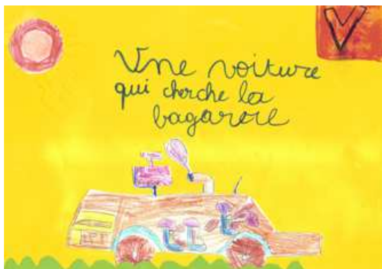
Léna - CM1