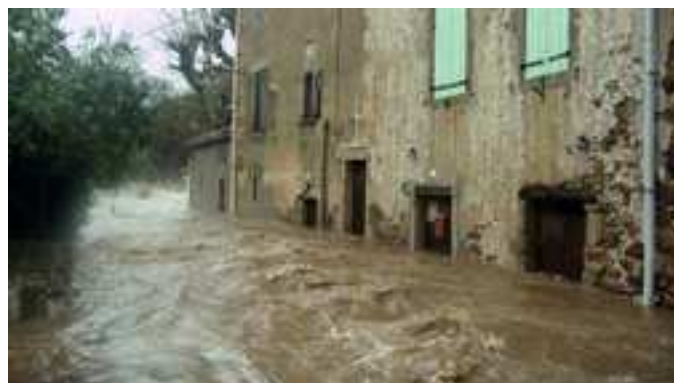
Traversée de Taillevent

Lunas a connu, au cours de son histoire, des crues très violentes. Notons celle du Gravezon de 1745 qui détériora les ponts de Nize, de l'Église, celle du 2 novembre 1937 d'un niveau quasi identique à celle de 2014 (parapets de l'église emportés, Barry inondé, eau dans l'Église), celles de 1982 et 1996 (eau limite au pont de l'Église). Pour l'Orb, les repères à l'entrée de Taillevent témoignent de cet historique : 1926, 1934, 1953 ou encore 1987, 1992, 1995, 1996, 1997 ou 2006. Le niveau maximum d'eau 2014 se situe entre 1926 et 1953.