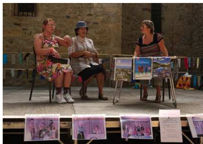
L'atelier théâtre sur les planches.

Fin janvier, l'association vivra son assemblée générale à laquelle tous les adhérents et futurs adhérents (allez, allez, rejoignez l'association, nous avons besoin de vous !) sont conviés. Une manière, pour ceux qui sont sur place ou peuvent venir y assister, de soutenir l'action de celles et ceux qui s'investissent dans son fonctionnement.