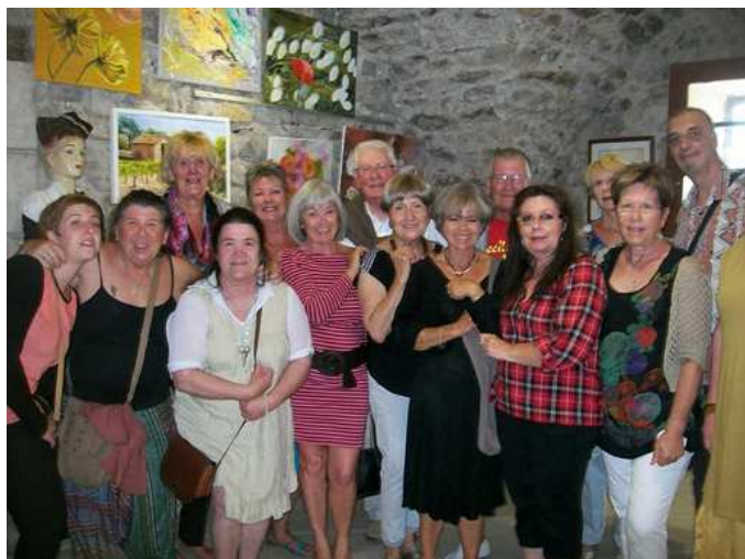
Les artistes de Lunas en juin, au Presbytère.

La suite au prochain numéro ! Nous pouvons déjà vous dire que la Fête de l'Eau, de la Nature et du Patrimoine est maintenue : programmation en cours.