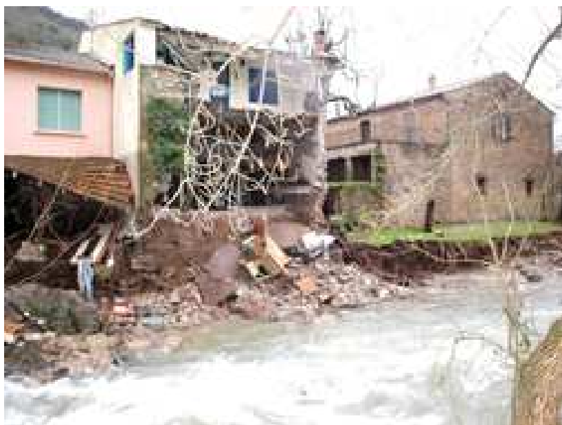
Le village, abords du Gravezon

* : Téléchargeable sur le site Internet de la Mairie