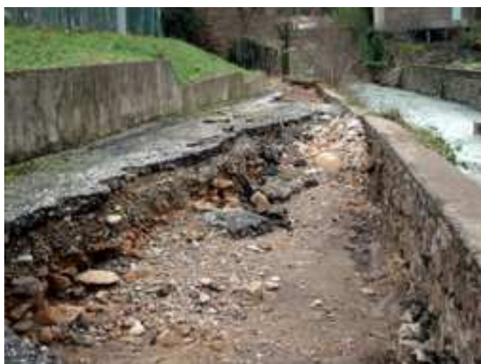
Les abords des terrains de tennis

De nombreuses habitations et exploitations agricoles sont touchées. Au total, les dégâts sur les propriétés communales, voiries et réseaux s'élèvent à bien plus de 600 000 €. Aujourd'hui quelques travaux très urgents ont été réalisés ou commandés mais il convient d'attendre le volume des aides financières qui seront allouées afin de programmer la totalité des chantiers.