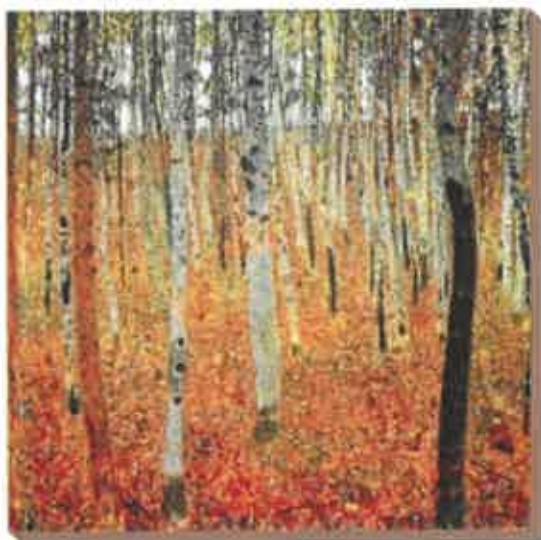
Forêt de hêtres

troncs, ils ont collé des feuilles d'automne pour constituer le feuillage et les feuilles qui tombent sur le sol. Venez voir notre magni-