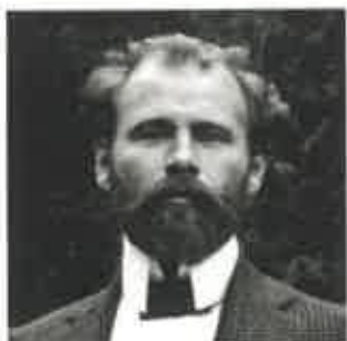
Artiste autrichien Né en 1862