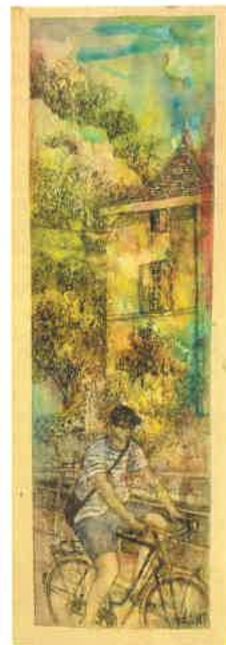
1 er prix Peintres dans la rue 2024 Denise URGELLI