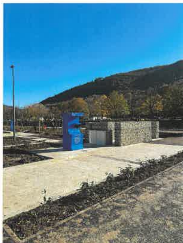
Aire de camping-car Ouverture en mars 2025

(cf art. le PHLV pour le détail de cette opération.